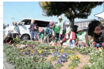
園芸ボランティア みらいの皆さん

新吉田地域ケアプラザなどで花壇の整備を行っています。お花のお世話が好きな人々が区内外から集まり、いつも笑い声でいっぱいの仲良しチームです。「ありがとうございます」という言葉が励みになります。いつまでも続けていきたい!とそのパワフルさが印象的。